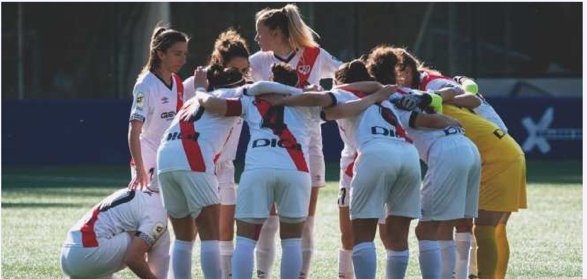
Arenga previa de nuestras jugadoras.

Tablas entre dos rivales directos que buscan seguir un año más en Primera Iberdrola.