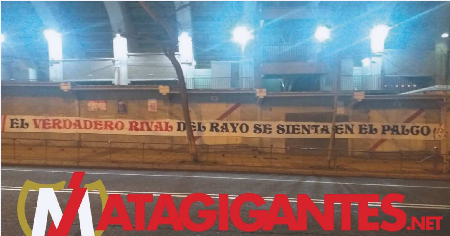
Pancarta desplegada en el Estadio de Vallecas

Análisis de las últimas diez Copas del Rey disputadas por el Rayo Vallecano