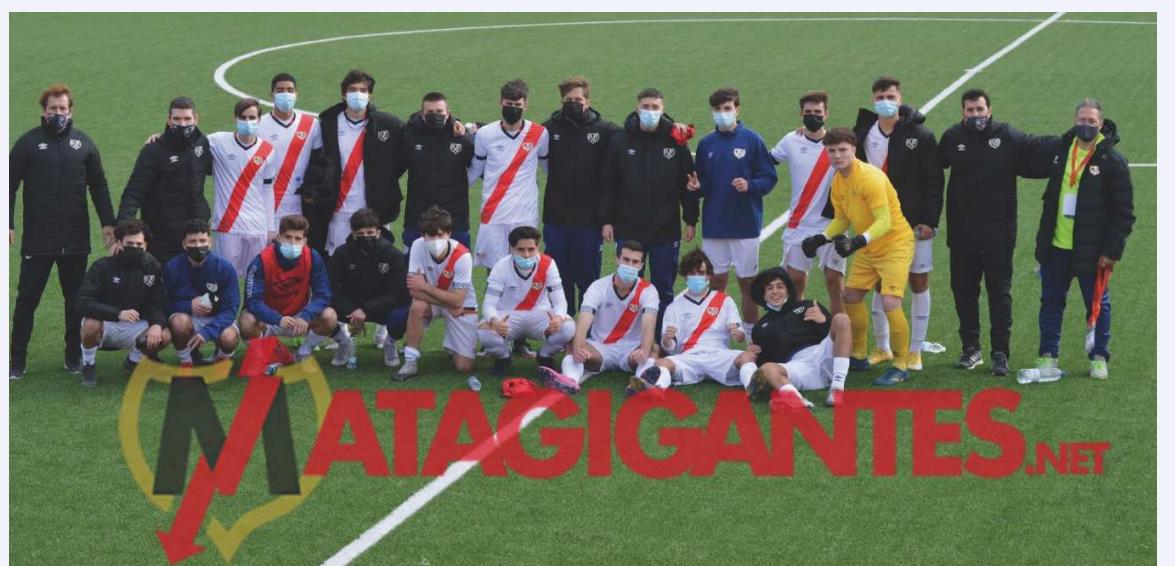
Integrantes del Juvenil B

Tres puntos muy importantes para afrontar la «Semana Fantástica» que el equipo tiene en estos siete días. Una vez superado el duelo frente al ED Moratalaz, ahora llegan las visitas al CD Móstoles URJC y al AD Torrejón.