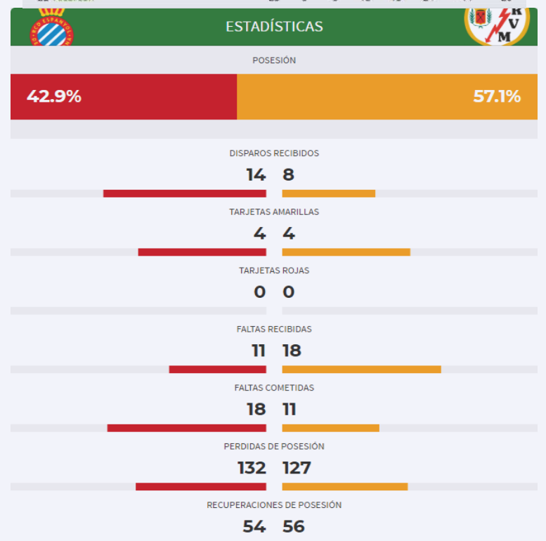
Estadísticas RCD Espanyol-Rayo Vallecano