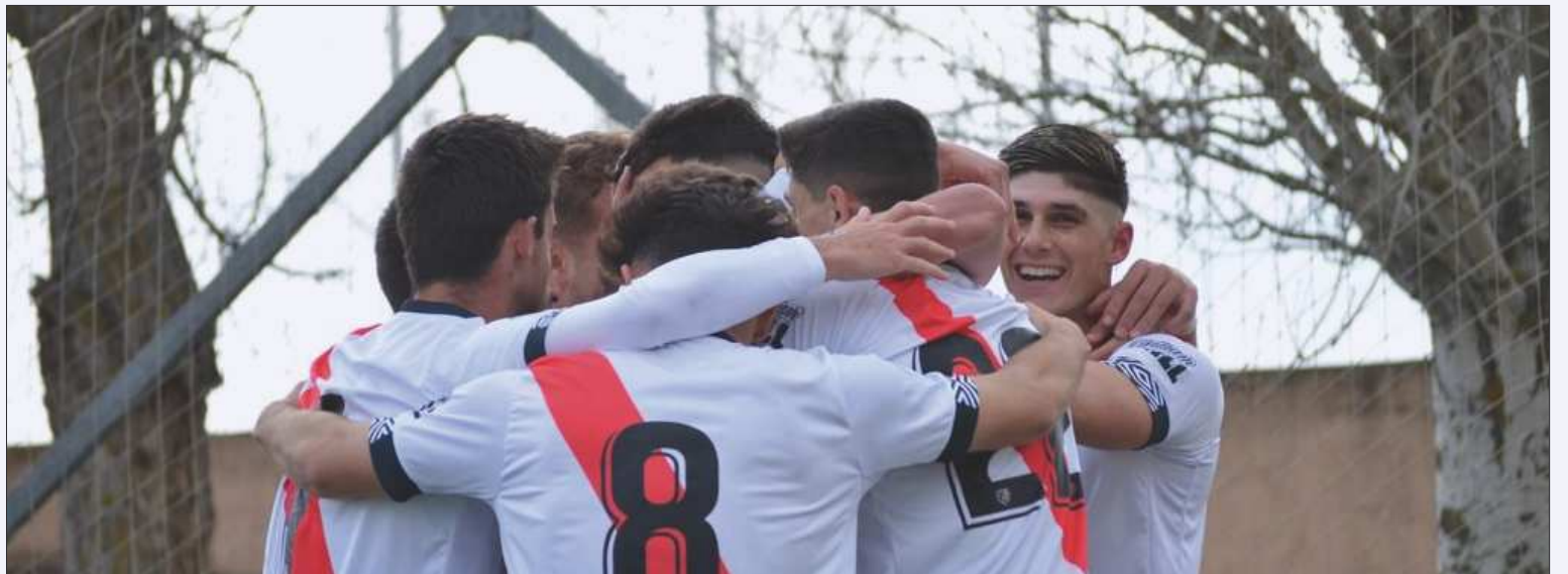
Los jugadores del Rayo B celebran uno de sus goles.

No tuvo un estreno agradable en el encuentro el nuevo meta, pues en el minuto 28, un balón en la frontal le llegó a Aguirre, principal responsable del do-