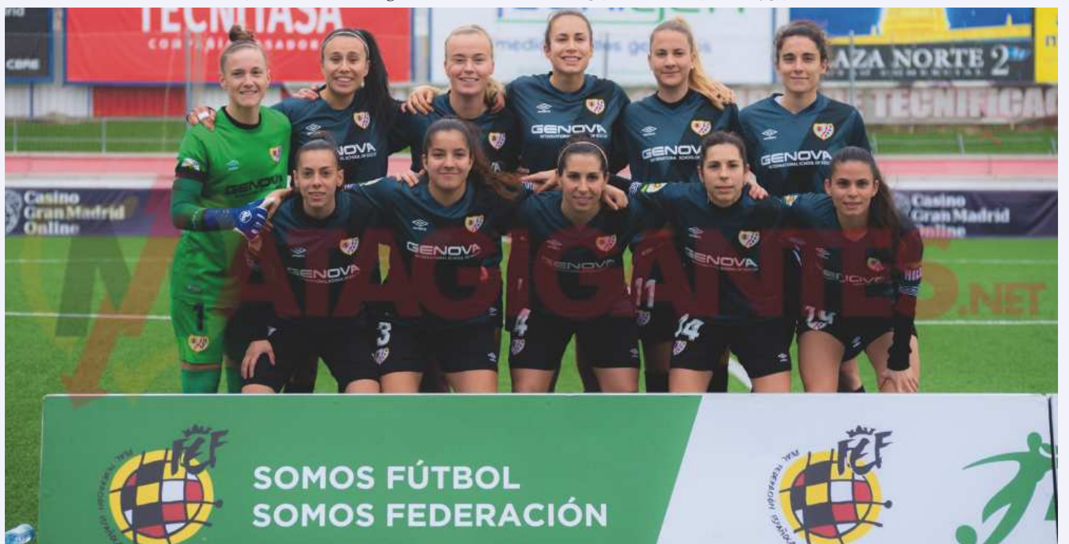
Once inicial del Rayo femenino en Matapiñonera.

Incidencias: Partido correspondiente a la 18ª jornada de Primera Iberdrola disputado en Matapiñonera a puerta cerrada.