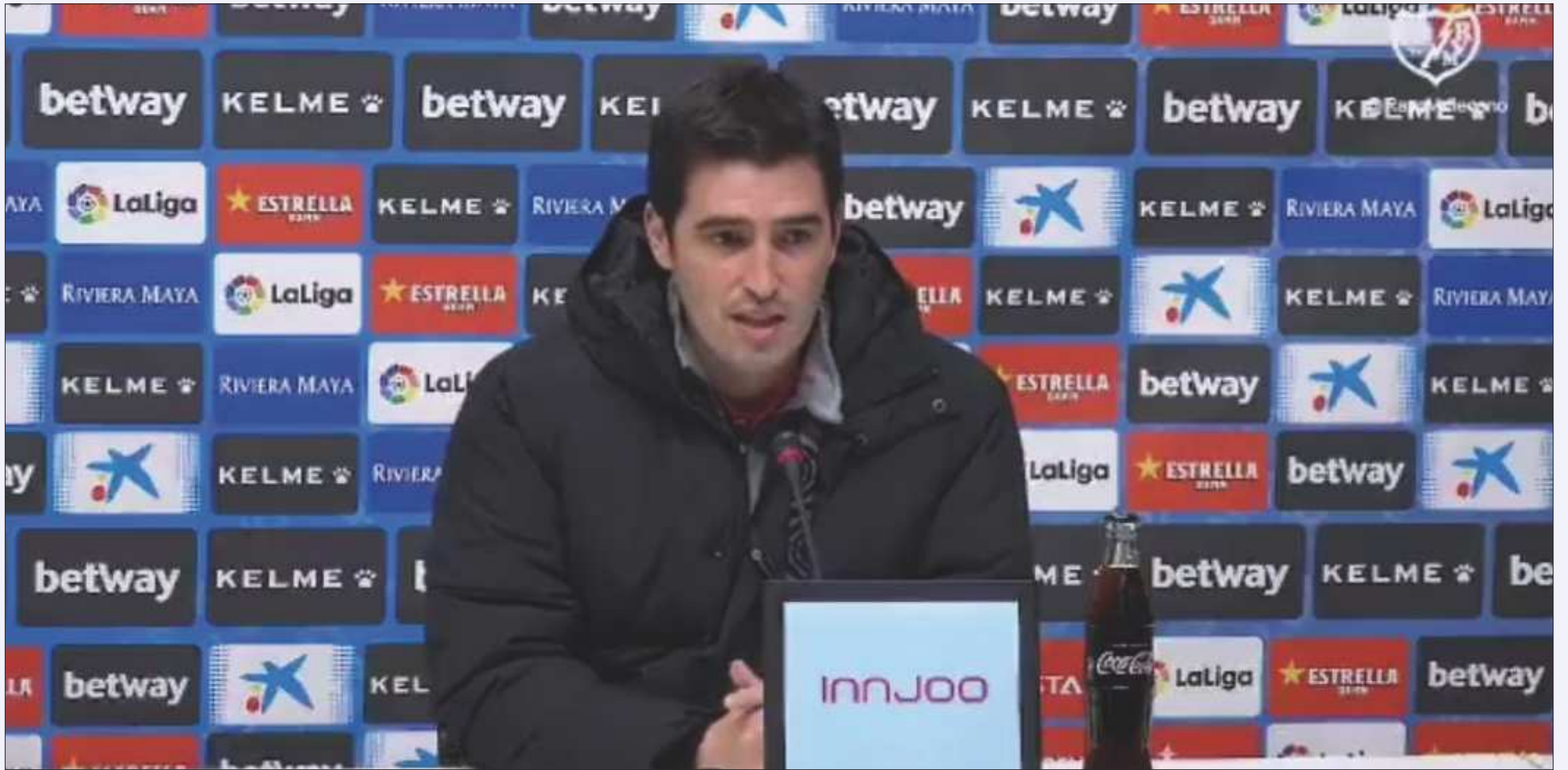
El entrenador del Rayo Vallecano Andoni Iraola en rueda de prensa