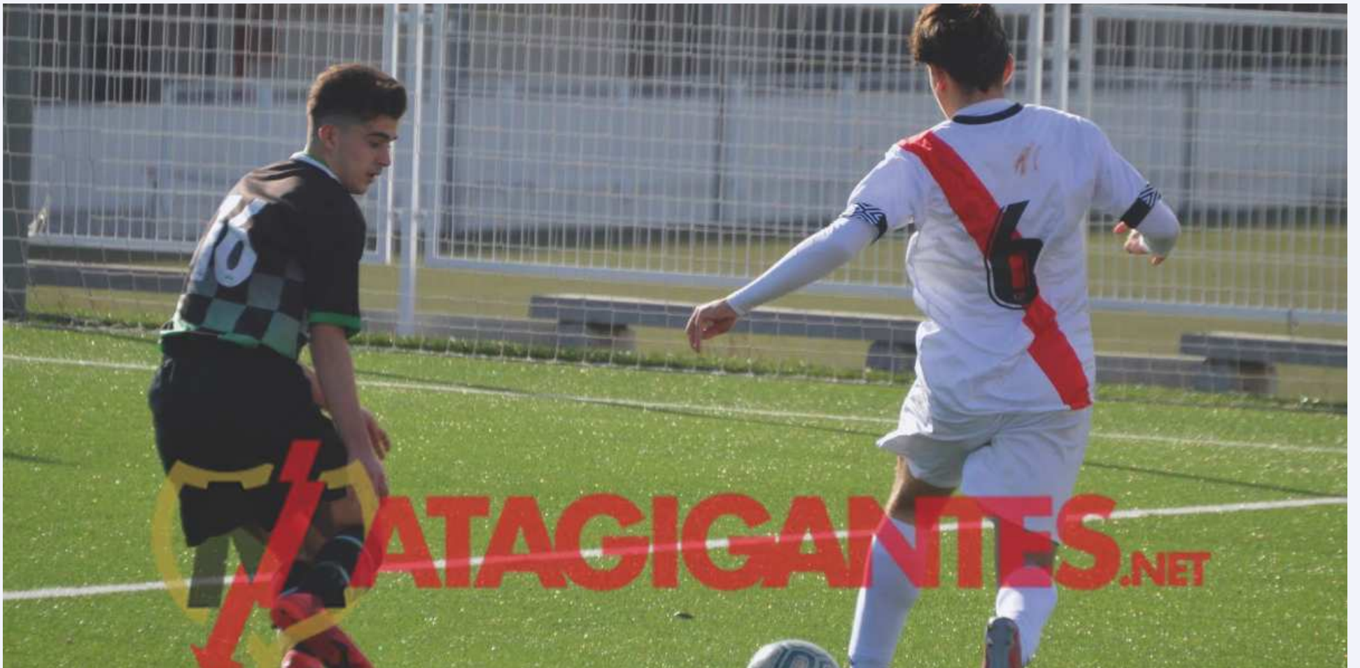
Acción ofensiva del Juvenil B

Victoria del Rayo Vallecano Juvenil B que sirve para mantener el liderato del grupo 12B con cuatro puntos de ventaja sobre el segundo clasificado