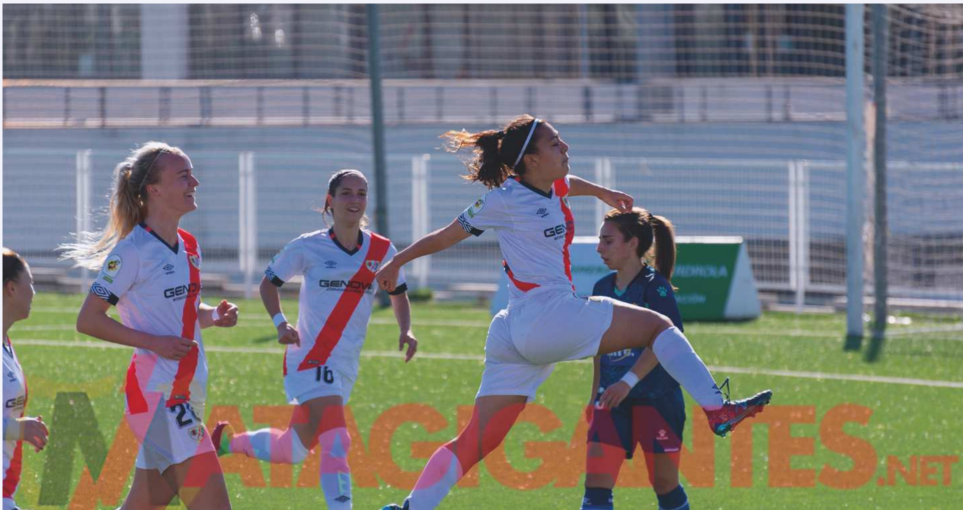
Jugadoras del Rayo celebran un tanto en el encuentro

Victoria muy importante del Rayo Femenino por 2-0 ante un rival directo