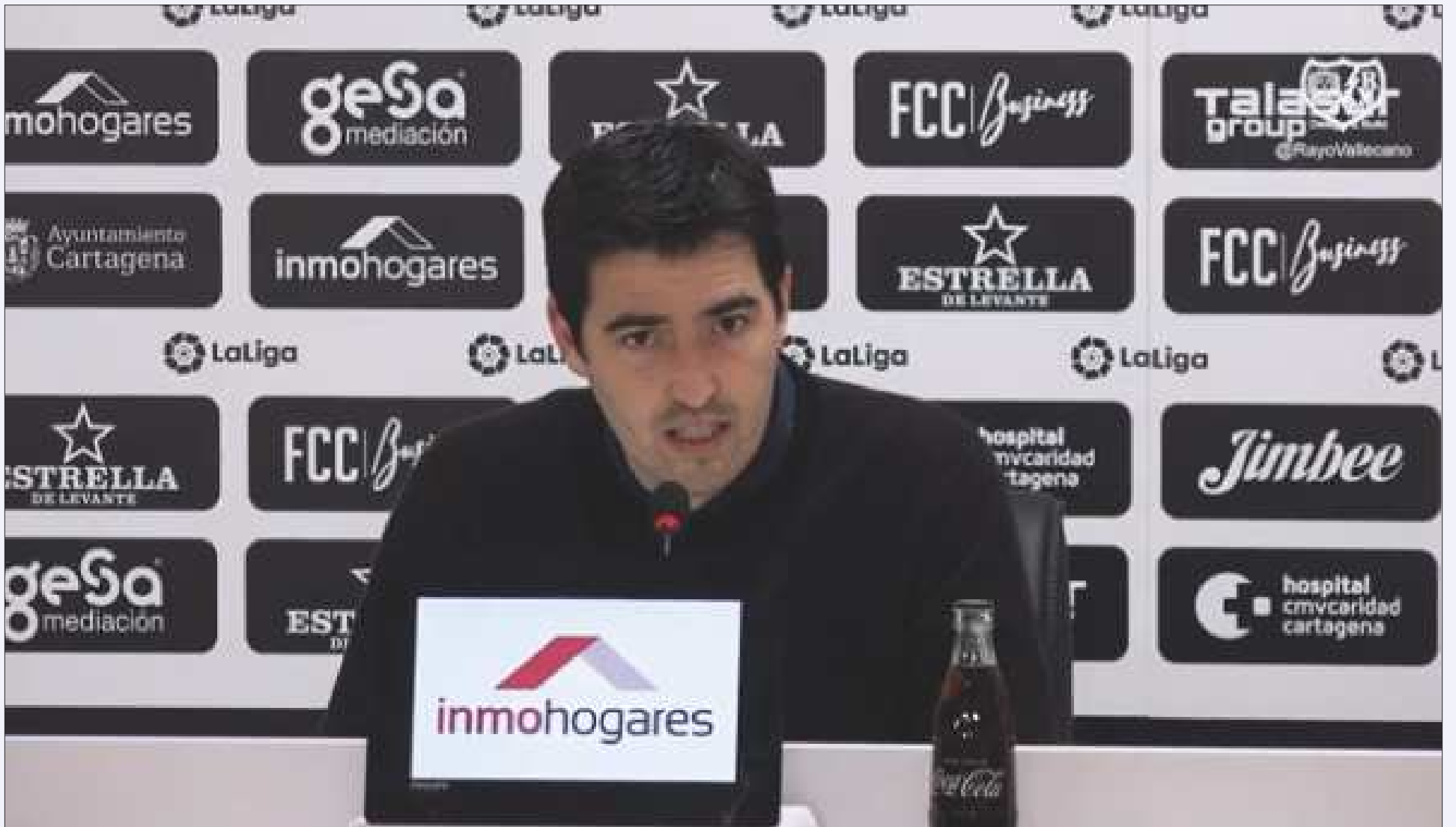
El entrenador del Rayo Vallecano Andoni Iraola en rueda de prensa