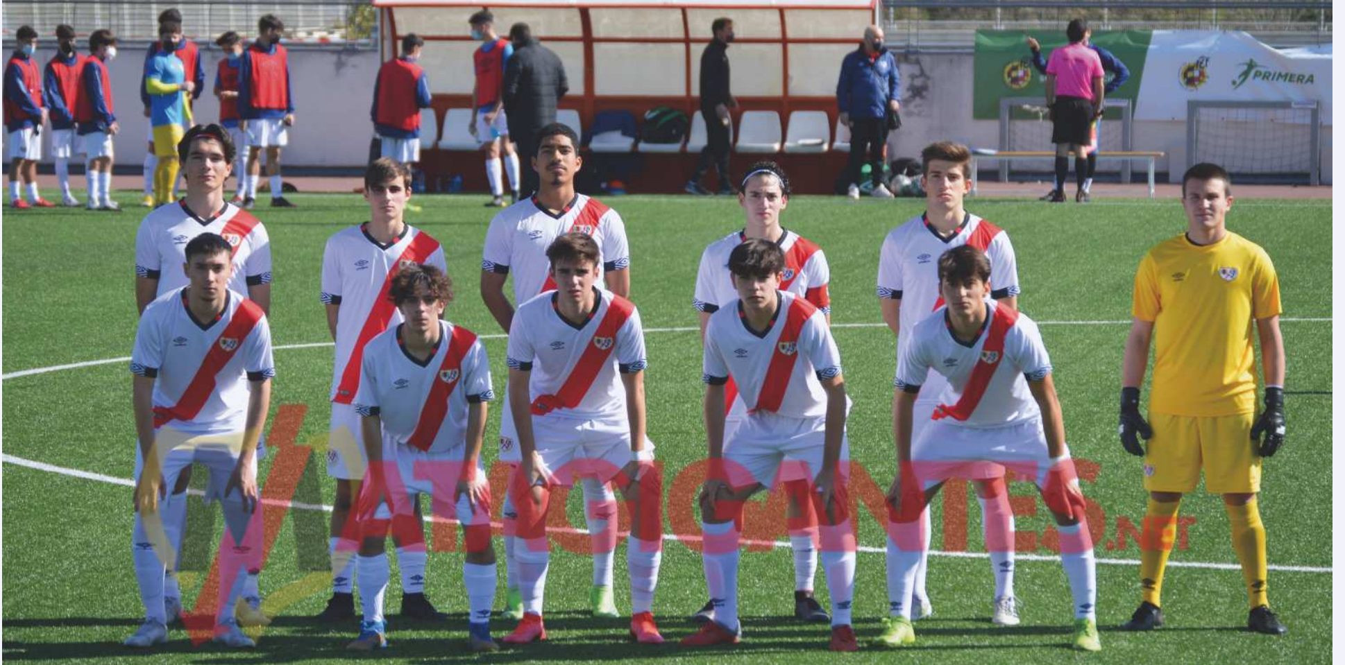
Once inicial del Juvenil B este fin de semana

El Juvenil B logra una importante victoria ante su más inmediato perseguidor, el CF Fuenlabrada.