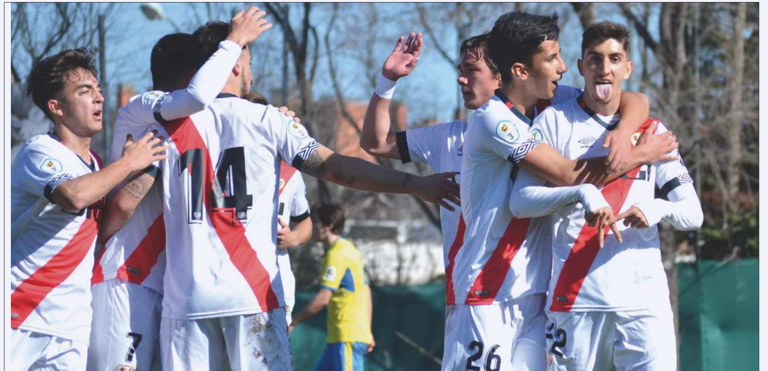
Los jugadores del filial celebran un tanto del encuentro.

Con el marcador favorable, los vallecánicos siguieron teniendo el mando psicológico del partido. No era un dominio en base al juego, ya que el campo no lo permitía. Pero sí estaba seguro de lo que hacía, peleando cualquier balón dividido que pudiera quedarse en el sitio, mandando a los suyos arriba a pelear en campo rival y provocando que el Santa Ana cayera en precipitaciones, nerviosismo y errores. Y ahí emergían los rayistas para, con poco, imponer su ley y abrir brecha en el electrónico en el minuto 18. Una fabulosa acción por banda izquierda llevó a Nacho Fariña a poner un centro perfecto al punto de penal. Ahí la fue a recibir Molina, quien en semifallo se la deja a Kevin, descolocando a defensas y portero y no teniendo más que empujarla. Segundo de la mañana del Rayo B y segundo de la campaña para Kevin, quien poco a poco va sumando goles a su casillero. El