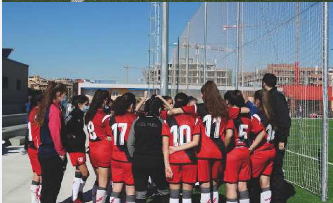
Instantáneas de nuestras chicas del cadete FRVM