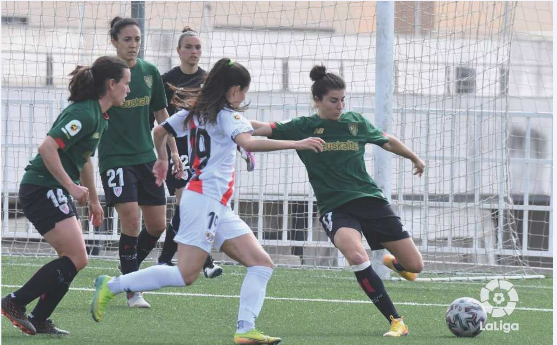
Isadora pugna con una defensa rival.

El Rayo Femenino cayó derrotado en casa ante el Athletic por 2-3, con hat-trick de la de Barakaldo. Bulatovic y Tere Morató anotaron los goles de las Guerreras.