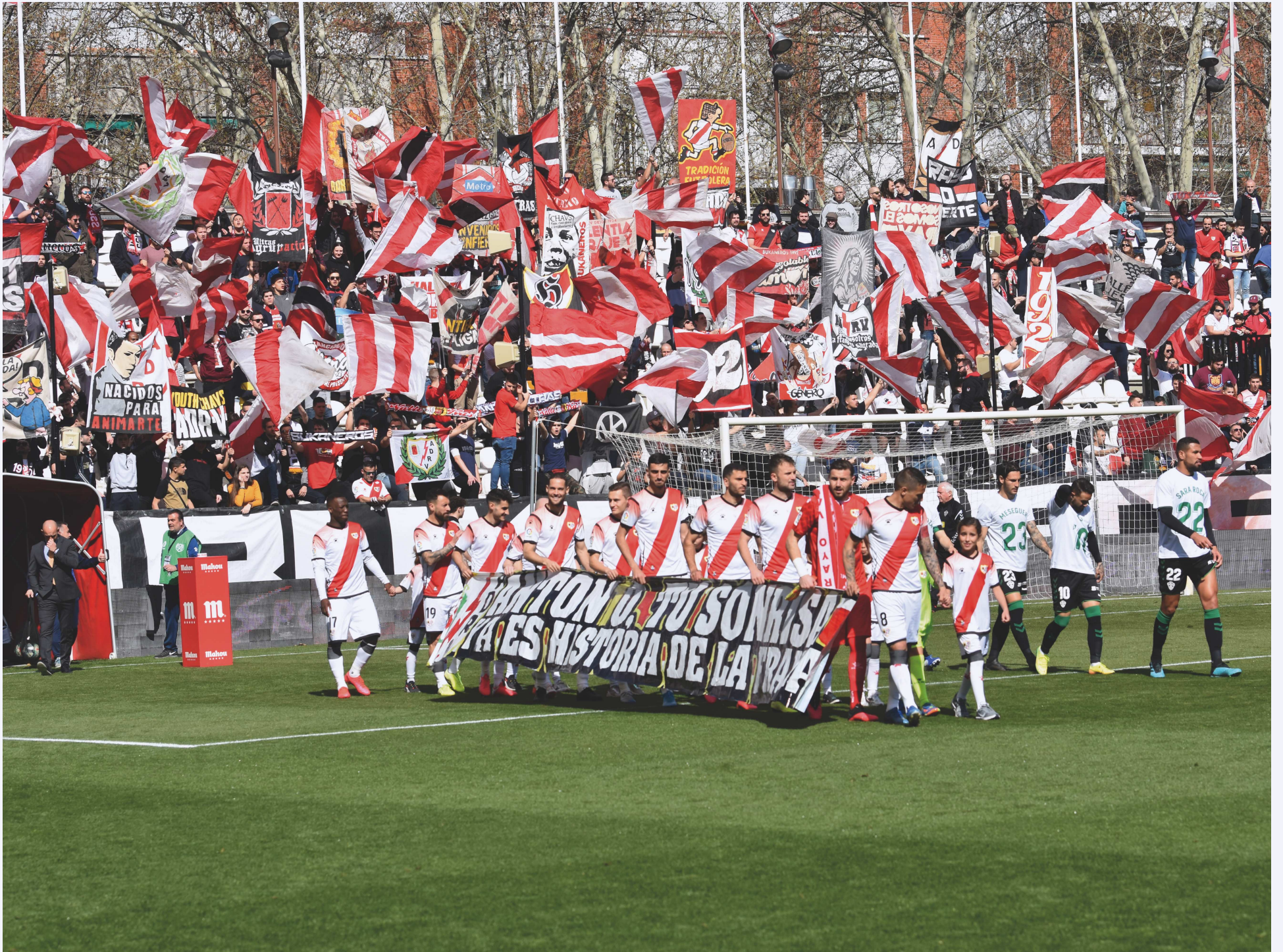
El Rayo Vallecano saltando al campo en un estadio a rebosar de público.