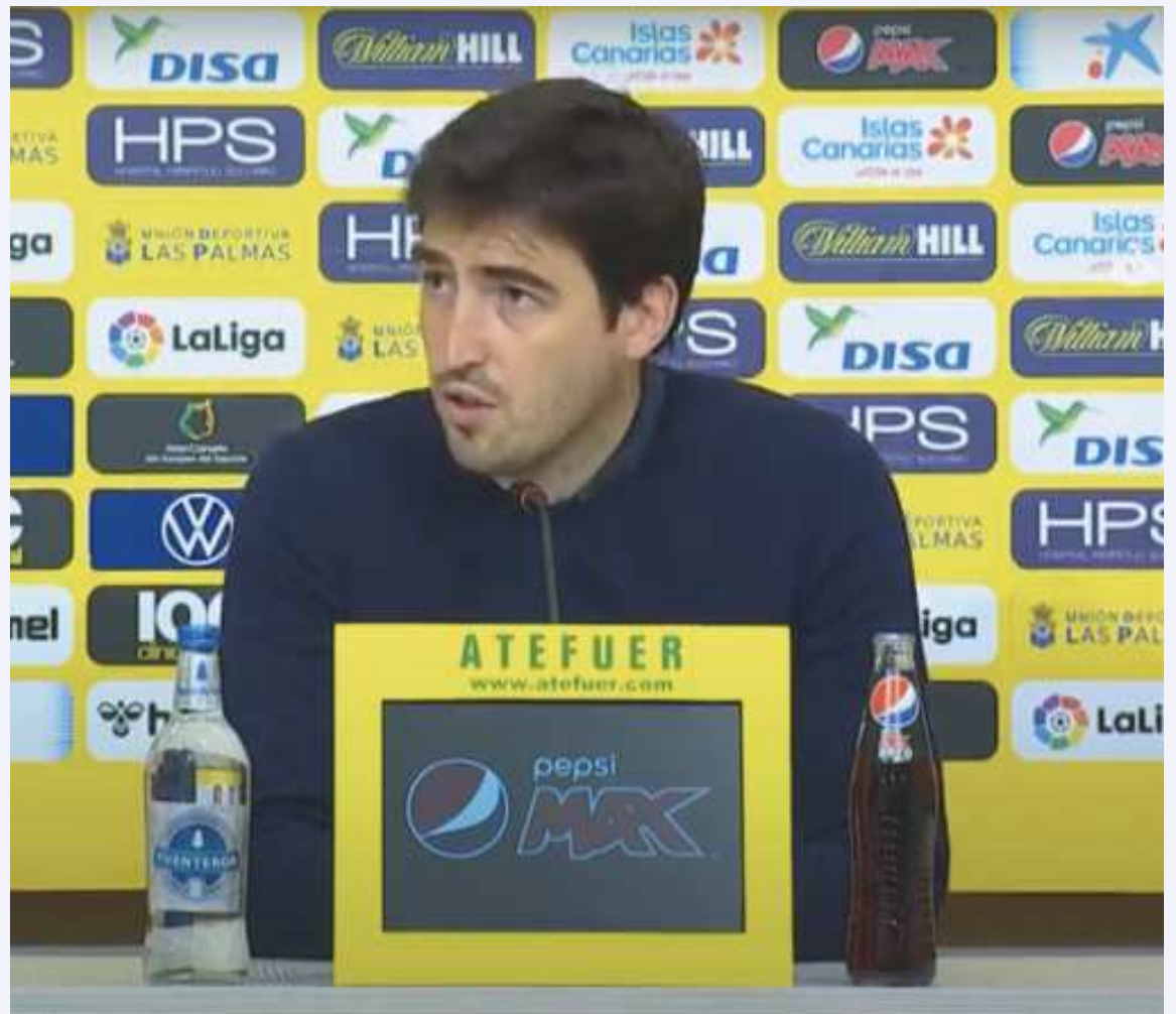
Andoni Iraola en rueda de prensa

I: Creo que Bebé venía de hacer una buena actuación el otro día, saliendo desde el banquillo. Hasta ahora lo hemos utilizado más de revulsivo que de inicio. Es verdad que Isi había comenzado a entrenar esta semana, pero no sabes como vas a responder físicamente después del Covid. Yo le veo bastante bien, pero me ha dado miedo meterle de inicio, porque hasta que no estás en el campo y te encuentras con la exigencia de un partido, no sabes cómo vas a responder.