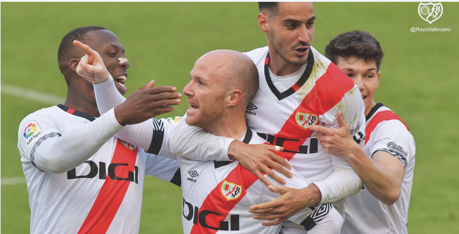
Jugadores del Rayo Vallecano celebran el tanto de Isi.

El Rayo logra una importantísima victoria en Vallecas ante un duro Girona por 2-1. Se adelantaron los visitantes, empató al instante Santi y, en la segunda parte, un zurdazo de Isi deja los puntos en casa.