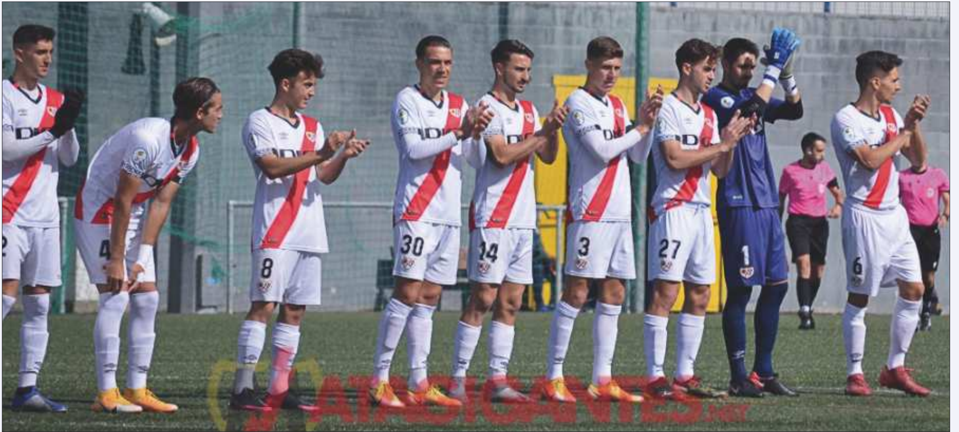
Formación inicial del Rayo B en el encuentro.

El Rayo B cae derrotado en su visita al Alcorcón B en un partido igualado que se definió en el tramo final.