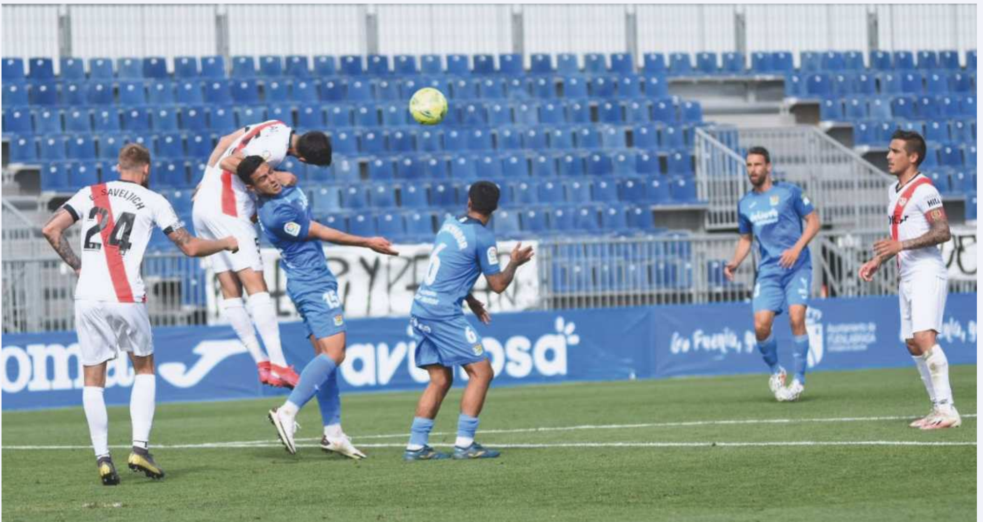
Catena disputa un balón aéreo en el encuentro.

Partido marcado por los errores y donde lo único salvable para el Rayo Vallecano es la victoria que le permite seguir en la lucha de los playoff a pesar de seguir jugando a nada.