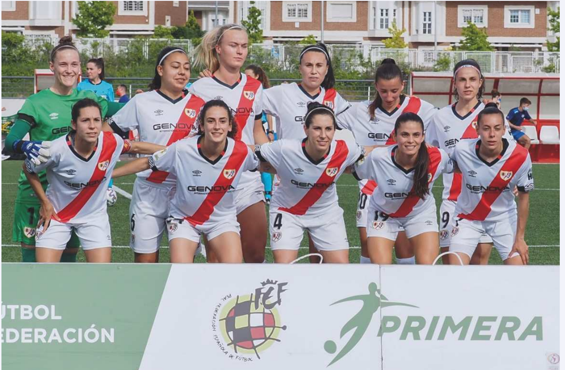
Once inicial del Rayo Femenino en el encuentro.

Derrota por la mínima ante una gran Real Sociedad, que supo aprovechar mejor sus ocasiones