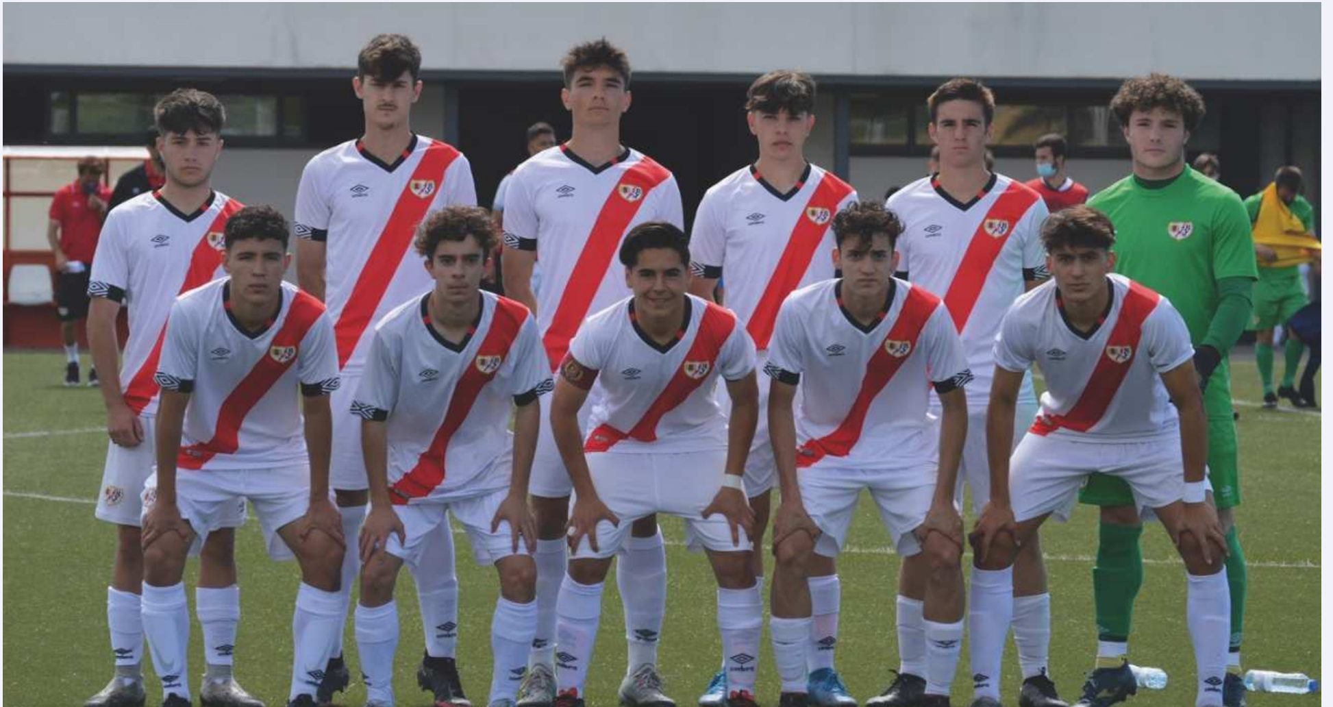
Once inicial del Juvenil A en el partido.

Los de Amaya pierden la oportunidad de sumar los 3 puntos al recibir un gol rozando el final. A pesar de ello, mantienen su racha de dar un gran nivel en el terreno de juego.