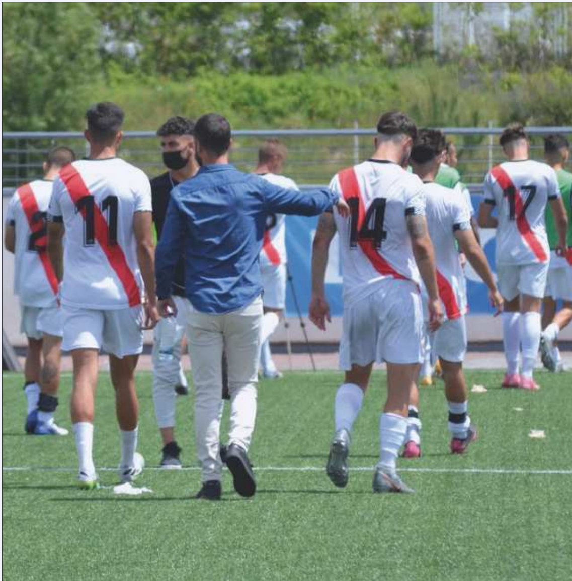
Abatimiento del mister y jugadores del Rayo B tras el partido.

El Rayo B se quedó a 4 minutos de las semifinales del playoff. El gol de Mario Magallares en el final de la prórroga da el pase al Torrejón y pone un duro punto final a la gran temporada de los de Ángel Dongil.